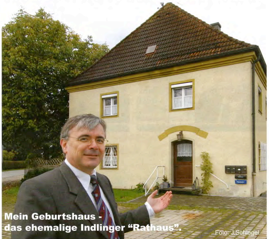
Mein Geburtshaus - das ehemalige Indlinger "Rathaus".

Wenn du dich nicht entscheidest, verlasse ich dich ! Deine Demokratie